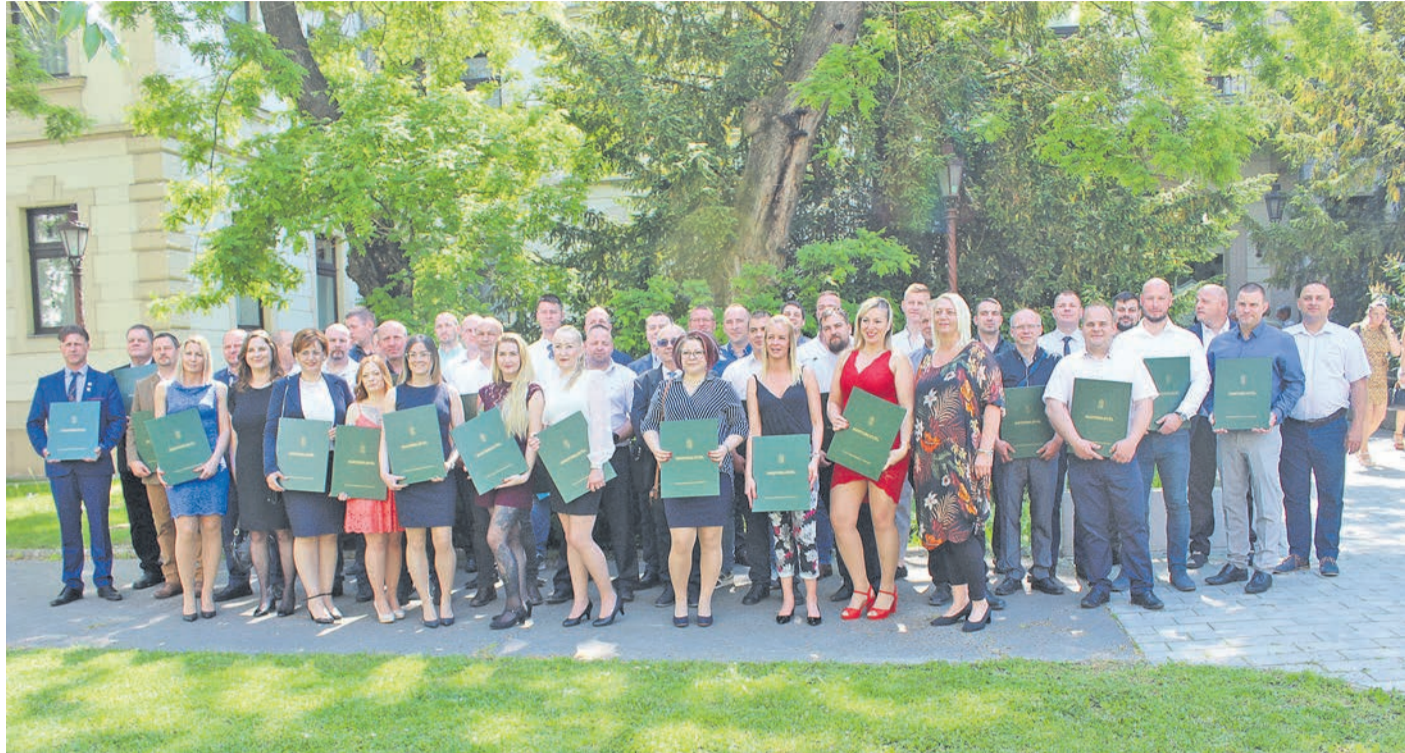
Ötven szakember vette át mesterlevelét a megyei kereskedelmi és iparkamara székházában

BÁCS-KISKUN A legmagasabb szakmai színvonalon szolgáltatnak