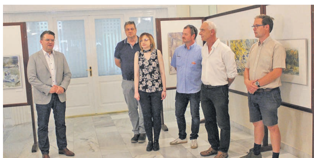
A művésztelepen nincs egy adott irányzat, a művészek szabadon alkothattak

A szponzor AXON céggel kapcsolatban elmondta, hogy a kábelgyártó vállalkozás 2009-től tagja a kamarának. A megnyitón Joachim Rilling ügyvezető igazgató magyar nyelven köszöntötte a kiállítás résztvevőit, nem először demonstrálva, mennyire szívén viseli a cége által támoga-